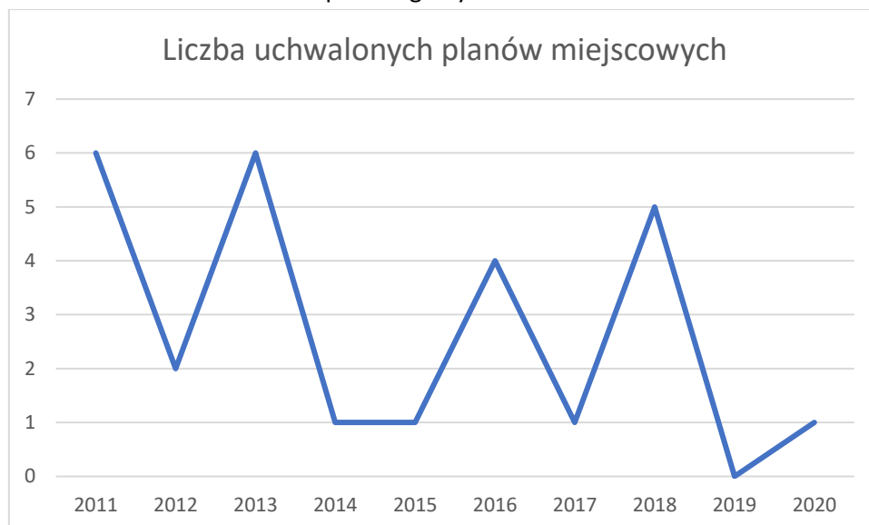
Wykres przedstawiający liczbę sporządzonych planów miejscowych i ich zmian w poszczególnych latach 2011-2020 r.

Dla terenów nie objętych planem w 2020 roku wydano 55 decyzji o warunkach zabudowy, w tym: 16 - dotyczących zabudowy mieszkaniowej jednorodzinnej, 5 - dotyczących zabudowy usługowej, 34 – obejmujących pozostałe funkcje, zaś decyzji o lokalizacji inwestycji